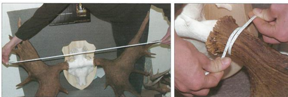
Joonis 1. Sarvede laiuse ja sarve tüviku ümbermõõdu mõõtmine

Tüvikute ümbermõõt – mõõdetakse tüvikute kõige peenemast kohast, kuid mitte kaugemalt kui 6 cm sarve kannasest. Mõõt esitatakse võimalusel millimeetritäpsusega (joonis 1).